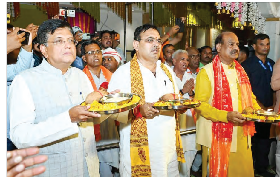
राजस्थान के मुख्यमंत्री भजनलाल शर्मा, लोकसभा अध्यक्ष ओम बिड़ला व केंद्रीय मंत्री पीयूष गोयल शुक्रवार को आस्थाधाम मेहंदीपुर बालाजी धाम पहुंचे।

ऑफ-व्हाइट रंग का शॉल ओढ़ रखा था। कन्याकुमारी पहुंचने के बाद भगवती अम्मन मंदिर में प्रार्थना और पूजा-अर्चना की। बता दें, आम चुनाव का प्रचार धमने के बाद पीएम मोदी हर बार आध्यात्मिक यात्रा पर जाते हैं और 2019 के चुनाव प्रचार के बाद वे केदारनाथ गए थे और साल 2014 में वे शिवाजी महाराज से संबंधित प्रतापगढ़ गए थे। पीएम मोदी पर निशाना साधने के अलावा, उन्होंने कहा कि आरक्षण छीनने का कोई सवाल ही नहीं है। आरक्षण एससी और एसटी समुदाय के लोगों को उनकी आबादी के अनुसार दिया जाना चाहिए। इसके अलावा, उन्होंने कहा कि पीएम मोदी गुजरात से हैं। गुजरात का व्यक्ति यह कहता है कि मैं महान्या गांधी को नहीं जानता तो मैं क्या कहूँ।