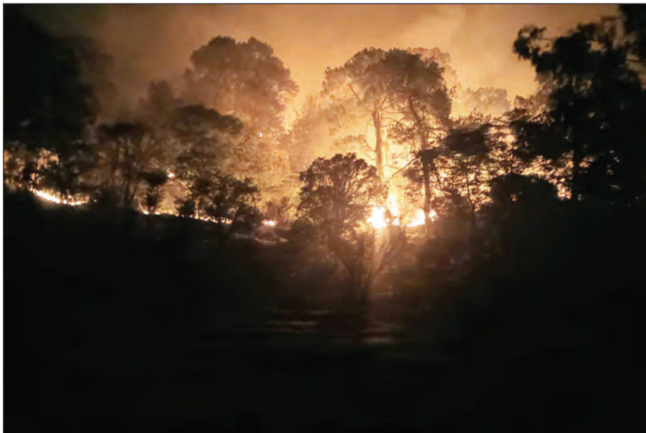
आग लगने की सूचना मिलते तुरंत से दमकल विभाग उप केंद्र झंडूता को सूचित किया गया।

▶▶ आग की भेंट चढ़ गया। आग से लाखों की वन संपदा के साथ कई जंगली जीव-जंतु जलकर राख हो गए