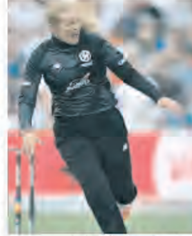
इस मुकाबले में इंग्लैंड ने पहले बल्लेबाजी करते हुए 50 ओवर में पांच विकेट खोकर 302 रन का विशाल स्कोर बनाया। टीम के लिए सबसे ज्यादा रन बनाने वाली खिलाड़ी साइबर-

एजेंसी चेम्पफोर्ड। इंग्लैंड की बाएं हाथ की स्पिनर सोफी एक्लेस्टोन महिला क्रिकेट में सबसे तेज 100 एकदिवसीय विकेट लेने वाली गेंदबाज बन गई हैं। उन्होंने यह उपलब्धि पाकिस्तान के खिलाफ तीसरे और अंतिम एकदिवसीय मैच के दौरान हासिल की। एक्लेस्टोन ने बुधवार को 4.1 ओवर के अपने स्पेल में तीन विकेट चटकाए, जिसमें उन्होंने सिर्फ 15 रन दिए। इस स्पेल के साथ, उन्होंने एकदिवसीय अंतरराष्ट्रीय मैचों में 100 विकेट पूरे किए। उन्होंने सिर्फ 64 मैचों में यह उपलब्धि हासिल की और ऑस्ट्रेलियाई महान केथरीन फिट्जपैट्रिक के रिकॉर्ड की बराबरी की, लेकिन ओवरों की संख्या (63) के मामले में रिकॉर्ड को पीछे छोड़ दिया। नेट साइबर-बंट के शानदार अंतरराष्ट्रीय प्रदर्शन ने इंग्लैंड महिला क्रिकेट टीम के बुधवार को चेम्पफोर्ड के काउंटी ग्राउंड में सीरीज के तीसरे और अंतिम एकदिवसीय मैच में पाकिस्तान को 178 रनों के बड़े अंतर से शिकस्त दी। इस जीत के साथ, इंग्लिश टीम ने तीन मैचों की एकदिवसीय सीरीज 2-0 से जीत ली।