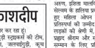
सर्षर्ष में मिला है, जो पहली बार शीर्षक प्रायोजक के रूप में साथ आया है। 'प्रेजेंटेंड बाय' प्रायोजक कर्नाटक सरकार ने लगातार पांचवें वर्ष इस आयोजन को अपना समर्थन दिया है। तीन दिवसीय सर्फिंग प्रतियोगिता में चार श्रेणियां पुरुष

होगी, जिसमें महत्वपूर्ण रैकिंग अंक होंगे जो सीजन के अंत में सर्फर्स की रैंकिंग निर्धारित करेगा। इस आयोजन को न्यू मैंगलोर पोर्ट अथॉरिटी से बड़ा समर्थन मिला है, जो पहली बार शीर्षक प्रायोजक के रूप में साथ आया है। 'प्रेजेंटेंड बाय' प्रायोजक कर्नाटक सरकार ने लगातार पांचवें वर्ष इस आयोजन को अपना समर्थन दिया है। तीन दिवसीय सर्फिंग प्रतियोगिता में चार श्रेणियां पुरुष