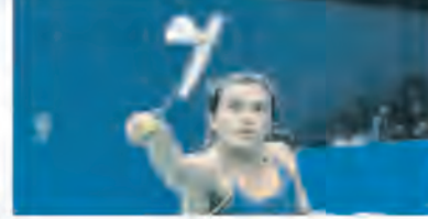
सषर्ष में 21-13, 11-21, 20-22 से जीत हासिल की। डेनमार्क ओपन सेमीफाइनल में हुई

एजेंसी सिंगापुर। दो बार की ओलंपिक पदक विजेता शटलर पीवी सिंधु और एएस प्रणय का गुरुवार को सिंगापुर ओपन में सफर समाप्त हो गया। सिंधु को जहां स्पेन की कैरोलिना मारिन ने शिकस्त दी, वहीं, प्रणय को जापान के केटा निशिमोटो ने हराया। सिंधु ने महिला एकल प्री-क्वार्टर फाइनल में रोमांचक मुकाबले में 18-15 की बढ़त गंवा दी और चिर परिचित प्रतिद्वंद्वी कैरोलिना मारिन से तीन गेम तक चले मैच में हार गईं। पिछले सप्ताह थाईलैंड ओपन में उपविजेता रहने के बाद, इस शीर्ष भारतीय शटलर ने रियो ओलंपिक फाइनल की अपनी प्रतिद्वंद्वी के खिलाफ पहला गेम जीता, लेकिन स्पेनिश खिलाड़ी ने वापसी करते हुए एक घंटे, आठ मिनट तक चले