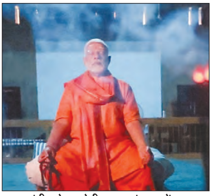
प्रधानमंत्री नरेन्द्र मोदी ध्यान मंडप में ध्यान करते हुए।